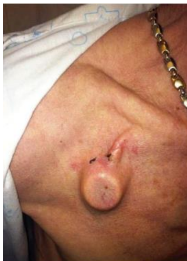
6. ábra. Négy héttel a beavatkozás után.