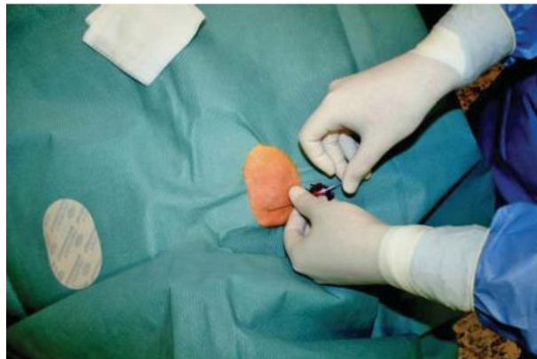
1. ábra. A vezetődrót helyre juttatása Seldinger-technikával.

helyzetének ellenőrzését. Gyártótól függően, a rendszer 1.5-3T teljesítménytartományban MR-ben is használható, és megfelelő gondozás mellett, akár 25 évig is bent maradhat [5, 16].