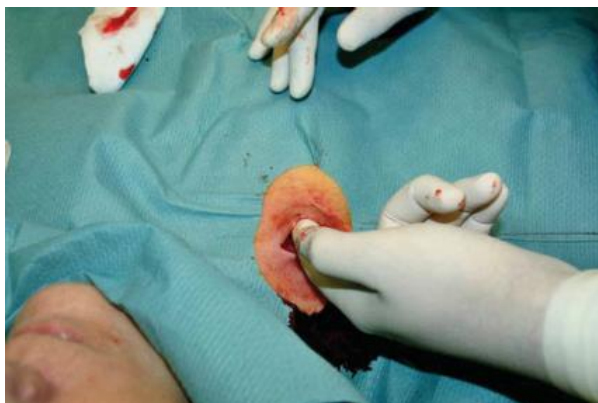
2. ábra. A mellkasi subcutan zsírban, a portkamra befogadására alkalmas tasak kialakítása.